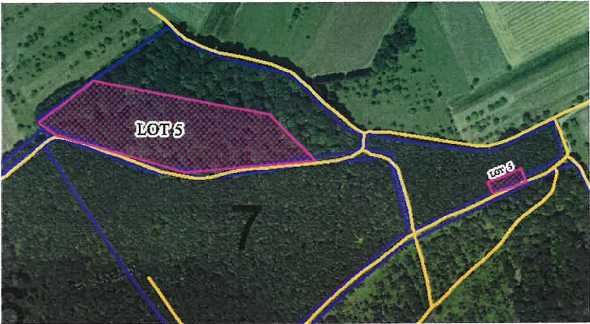
Fond de coupe Parcelle 29